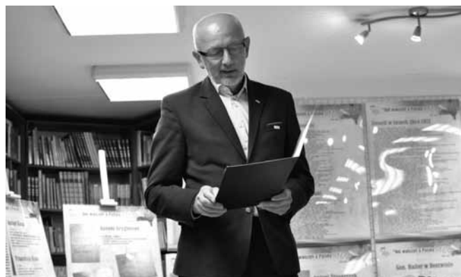
Honorowy patronat nad wydarzeniem objął senator Andrzej Kamiński

lejnymi miejscami pobytu. Rodziny pieczołowicie przechowują różne pamiątki, a dzięki życzliwości wielu osób wykorzystano je w bibliotece.