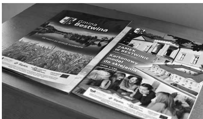
Najnowsze publikacje o gminie Bestwina