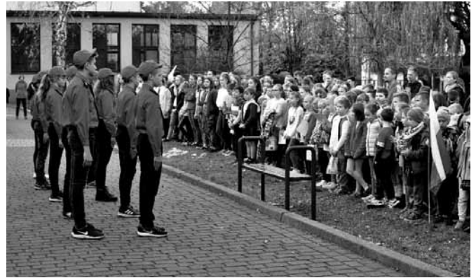
Pokaz musztry MDP Kaniów