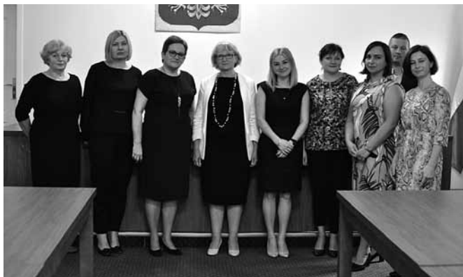
Nagrodzeni przez wójta nauczyciele