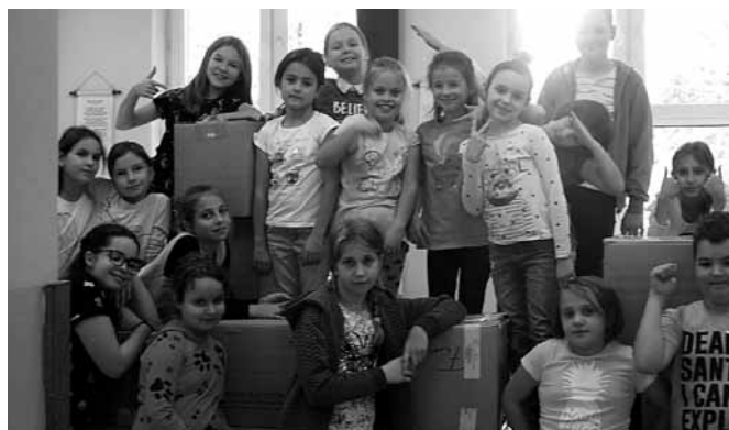
Mikołajowa drużyna pomogła rówieśnikom z Kresów