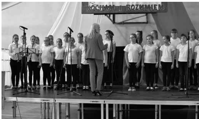
Jedną z nagród Grand Prix zdobył chór „Cantata”

Przedszkole – zespół do 10 osób: 1. „Sześć plus trzy” (Bestwina); 2. Zespół wokalny (Bestwina)