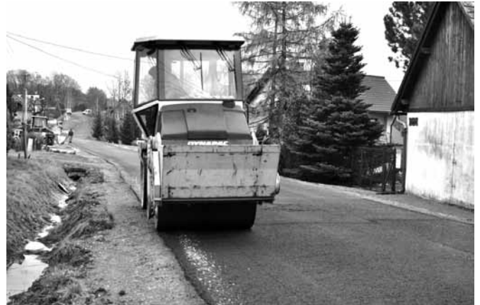
Asfaltowanie ul. Górskiej

Rozpoczęły się prace związane z remontem ul. Sosnowickiej w Kaniowie . W ramach zadania wykonana zostanie nowa