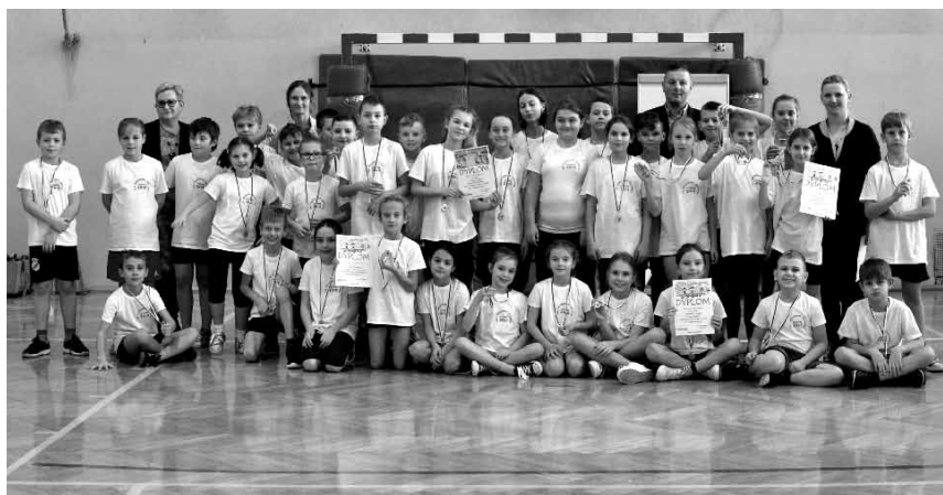
W klasyfikacji generalnej wygrała reprezentacja Bestwiny