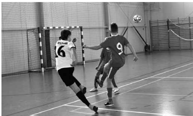
Dynamiczna akcja w meczu trampkarzy