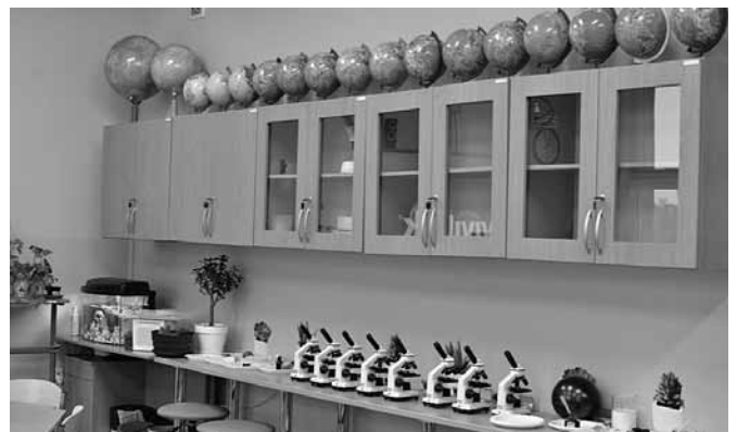
W Zielonej Pracowni znalazły się nowoczesne mikroskopy