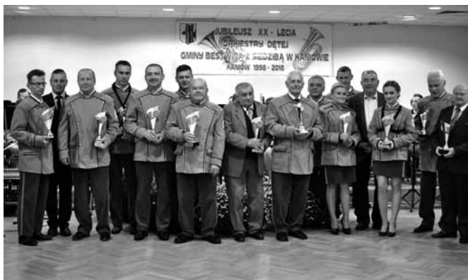
Nagrodzeni członkowie gminnej orkiestry

Orkiestra liczy obecnie 53 osoby, a przez dwie dekady przewinęło się przez jej szeregi ok. 200 artystów. Grają wszystko: marsze, muzykę filmową, przeboje gwiazd (Maryli Rodowicz, Michaela Bublé, ABBY, Deep Purple), piosenki biesiadne, pieśni patriotyczne, kościelne, kolędy, standardy folkowe i jazzowe. Niejako „dziećmi” gminnej orkiestry są chór PeZet i młodzieżowa