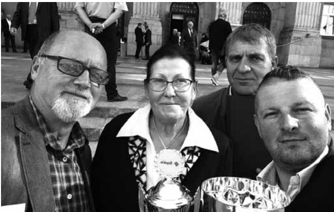
Delegacja gminy Bestwina