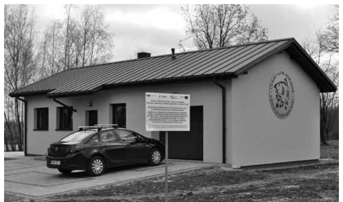
„Rybaczówka” w Kaniowie

Podczas uroczystości otwarcia w dniu 28 listopada prezes nawiązał do zbliżającej się 40 rocznicy powstania sekcji wędkarskiej. Omówił historię powstania „Rybaczówki” i serdecznie podziękował za setki godzin zaangażowania, za społeczną pracę, która pozwoliła wykonać więcej, niż przewidywał pierwotny pro-