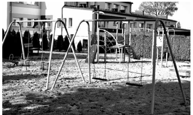
Ogólny widok na nowy plac zabaw

Na terenie Zespołu Szkolno-Przedszkolnego w Bestwinie oddano właśnie do użytku przedszkolaków nowy plac zabaw, wyposażony w duży zestaw zabawowy, dwie huśtawki podwójne, huśtawkę równoważniczą i trzy zabawki sprężynowe. Jego utworzenie jest elementem realizowanego w Bestwinie projektu współfinansowanego przez Unię Europejską ze środków Europejskiego Funduszu Społecznego w ramach Regionalnego Programu Operacyjnego Województwa Śląskiego na lata 2014-2020 pn. „Wesołe przedszkolaki w Bestwinie”, mającego na celu zwiększenie dostępności do wysokiej jakości edukacji przedszkolnej na terenie gminy Bestwina poprzez utworzenie dodatkowego oddziału przedszkolnego dla 25 dzieci oraz zwiększenie szans