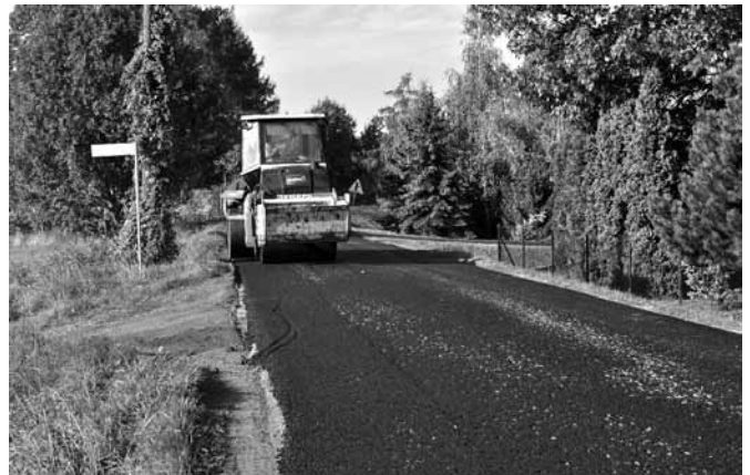
Ul. Młyńska w Kaniowie