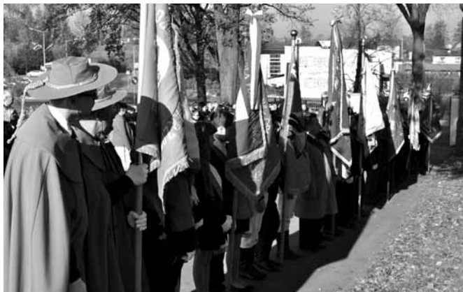
Poczty sztandarowe zgromadzone pod pomnikiem w Bestwinie

Nasze pokolenie nie dożyje kolejnego tak doniosłego jubileuszu. Tym bardziej należy świętować, wywiesić biało – czerwona flagę, odśpiewać hymn, opowiedzieć o Polsce dzieciom. Cały kraj na różne sposoby uczcił okrągły wiek jaki minął od końca I wojny światowej i odrodzenia się naszego państwa. W Warszawie i w innych miejscach odbyły się marsze, akademie, koncerty, pokazy rekonstrukcyjne i inne ciekawe wydarzenia. Jak wyglądało to w gminie Bestwina?