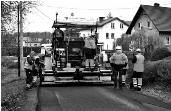
Remont ul. Pszczelarskiej

ul. Młyńska w Kaniowie - inwestycja zrealizowana przez Zarząd Dróg Powiatowych w Bielsku – Białej. Na odcinku od