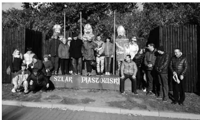
W towarzystwie piastowskich wojów

dziców (głównie seniorów) zrzeszonych w Stowarzyszeniu „RAZEM” oraz młodzież ze Szkoły Podstawowej im św. Jana Kantego, której Stowarzyszenie poprzez wyjazd chciało dodatko-