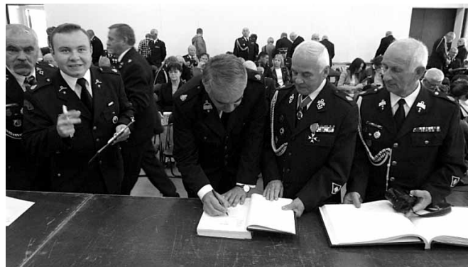
Do kroniki wpisuje się Prezes Zarządu Głównego ZOSP RP Waldemar Pawlak