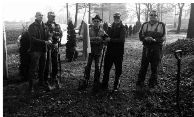
Sadzenie drzewek w parku wiejskim w Kaniowie

Następnego dnia piąto – i szóstoklasiści uczestniczyli w grze terenowej ulicami Bestwiny. W charakterystycznych punktach sołectwa takich jak park zamkowy, czworaki, „Ryszkówka”, strażnica OSP, Muzeum Regionalne, cmentarz parafialny itd.